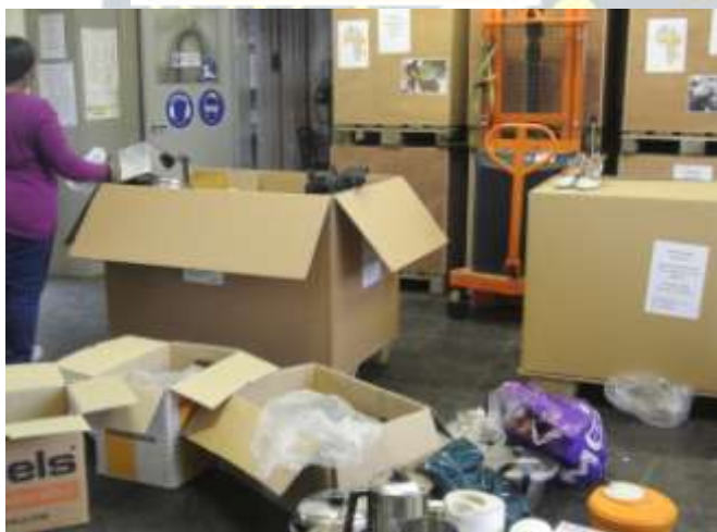
Emily pakt de kisten graag zelf in