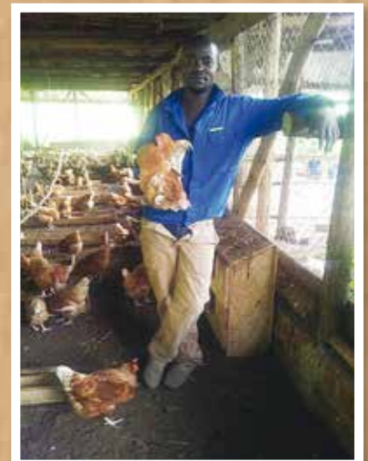
Kippenboerderij in Uganda