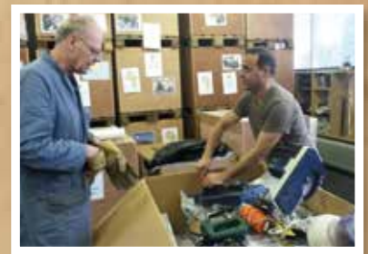
De kist wordt gevuld