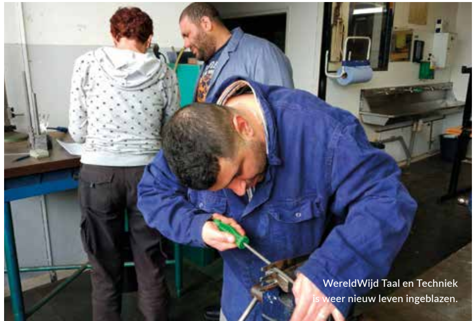
WereldWijd Taal en Techniek is weer nieuw leven ingeblazen.

WereldWijd heeft onderzocht wat er zoal gedaan wordt aan onderwijs en integratie aan buitenlandse mensen in Maastricht en het Heuvelland. Dat bleek opvallend veel te zijn. Naast de verplichte inburgering bleken er in de regio tal van initiatieven te bestaan die taal- en integratieactiviteiten aanbieden. We waren echt niet meer de enige... Maar daarom niet getreurd, we zochten contact met diverse organisaties en ook met de gemeente Maastricht om “Vaktaal” onder de aandacht te brengen. Voorts werden er folders en flyers ontwikkeld en verspreid. Al snel werd duidelijk dat wij ons niet in een concurrerende positie moesten