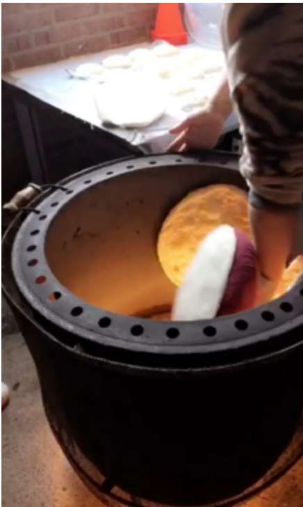
Iza bakt het brood

Onlangs werd ik uitgenodigd door Iza, een van onze cursisten. Iza komt uit Irak en woont in Ulestraten, een kleine 4 kilometer van mijn huis vandaan. Hij komt vaker langs ons huis gefietst als hij op weg is naar het winkelcentrum in Beek. Tijdens een van die fietstochtjes herkende ik hem en nodigde ik hem uit voor een kop koffie.