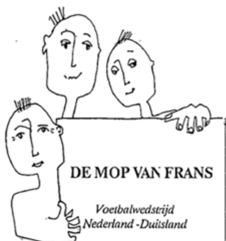
Colofon van de allereerste editie van de Wereldwijzer

Redactieadres: Stichting Wereldwijd Klompenstraat 1a 6251 NE Eckelrade tel: 043- 4083122